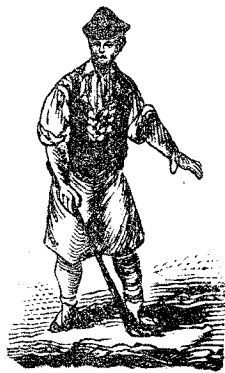
A Mariapapa la Roja, partio de la Azacaya, junto al partior del Cherro, lincia Los Garres.—ESPAÑA.

Pepa; sabrás como al cabo alleguemos á la Bana, en un barco de la mar que nos trujo por el agua y nos hizo echar el ámago con los meneos que daba. Yo estuve más de ocho dias con ambustias y con ansias, y hasta el mesmo comendante pensé que ar fin espichaba, porque echó hasta las papillas, se le amarató la cara y hablaba dando berrios como una presona mala. Yo, la verdá, me pensé que allí en la mar me queaba ú á Nuestro Páere Jesús me gorbiban en la caja, pero á juerza de café, tila caliente y horchata y friegas de lechanis por la canal de la esparda que nus daba un cerujano con un cacho de toballa, juimos entrando en calor y ya estoy güeno, á Dios gracias.