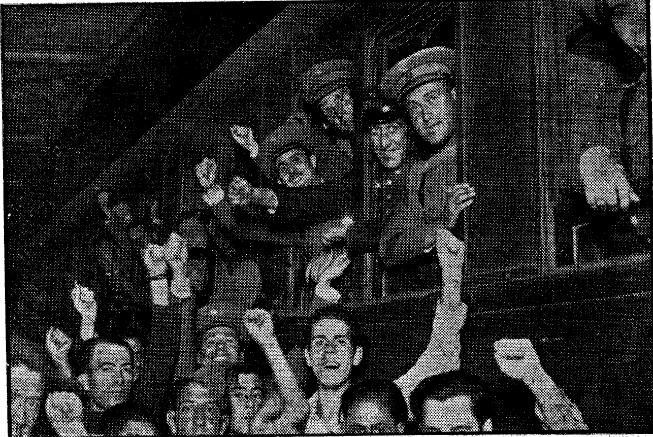
CARTAGENA.— Los carabineros que van al frente. Destacamos esta foto gráfica de los bravos luchadores que han dado mil pruebas de lealtad y de abnegación